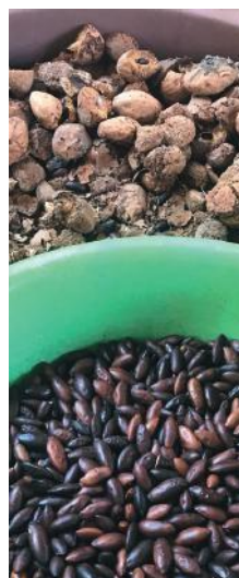
Figuras: Baru e alguns exemplos do seu beneficiamento realizado pela comunidade de Nioaque