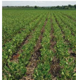
Figura: Soja no Sistema ILP 04/03/2022

Esse projeto não apenas alcançou resultados importantes, como a melhoria da qualidade do solo e a maior taxa de absorção de água, especialmente nos sistemas que incorporam pastagens, mas também evidenciou uma resiliência superior do plantio direto e da integração lavoura-pecuária durante estiagens severas, como a enfrentada na safra 2021/2022 em Mato Grosso do Sul.