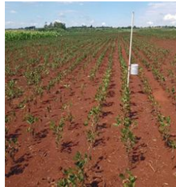
Figura: Soja em PC 04/03/2022