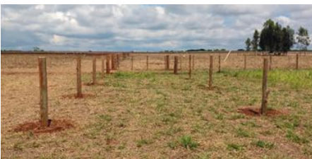
Figuras: Imagens mostrando os diferentes tipos de manejo na área experimental devido ao recurso disponibilizado pelo PRS-Cerrado