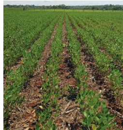
Figura: Soja no SPD 04/03/2022