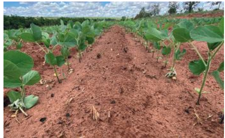
Figuras: Cobertura do solo em área de ILPF e Plantio Convencional