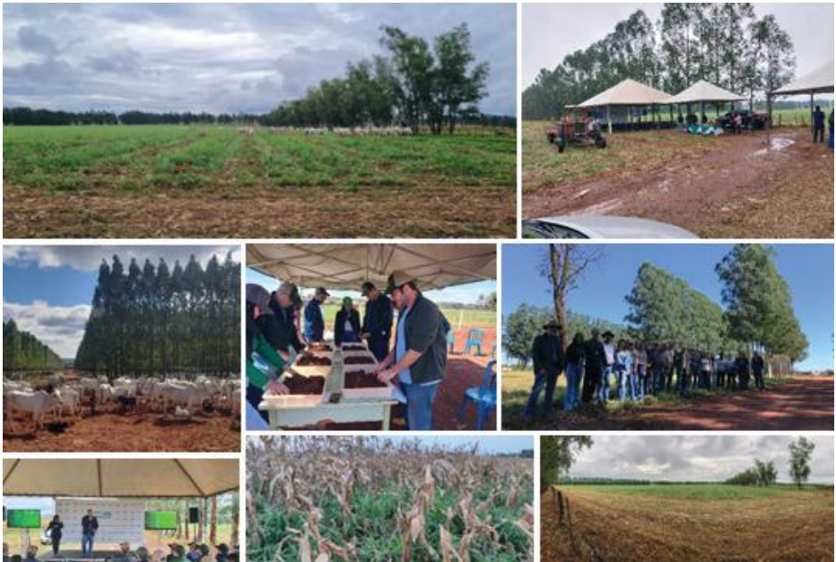
Figuras: Campanhas de trabalho de campo no estado

Venha descobrir os resultados que podem ajudar a melhorar as políticas públicas e colaborar para um futuro agrícola mais sustentável em Mato Grosso do Sul!